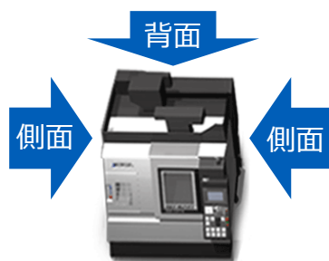
銘板、電源ブレーカの場合